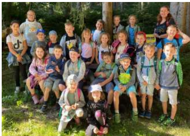
Wandertag 1. Klasse