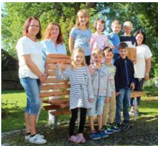
Unsere heurigen Tafelklassler