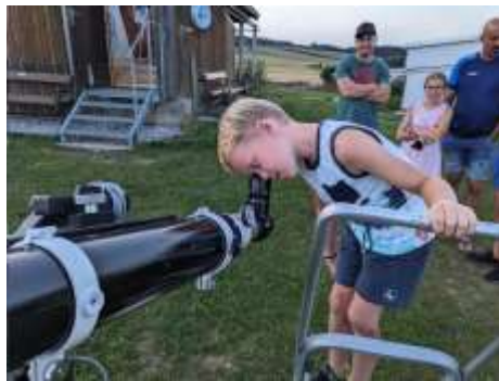
Mond schauen Kids