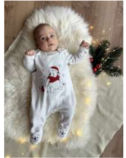
Sophia Strebl Wiesmühlenweg 4, 18. September 2023