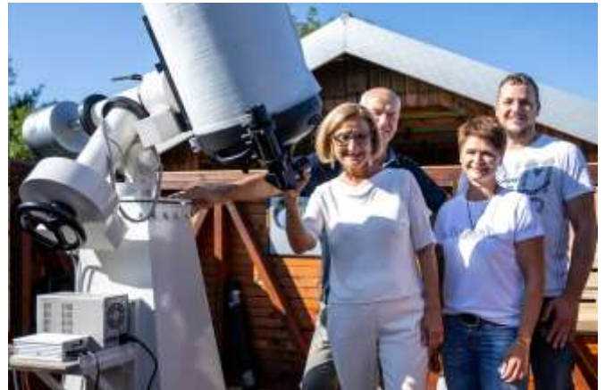
AZM-Vorstand präsentiert Landeshauptfrau Mikl-Leitner das neue Vereinsfernrohr