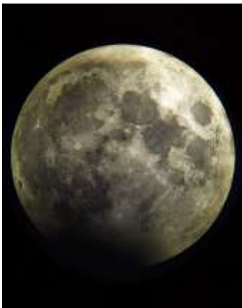
Bild von der Mondfinsternis im Oktober