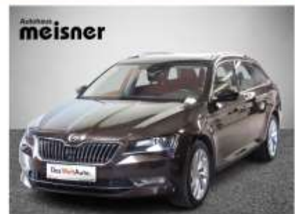
Škoda SUPERB Combi 4x4 TDI DSG 190 PS, EZ: 3/18, 74.500 km Navigationssystem, Anhängervorrichtung, Standheizung, u.v.m. Aktionspreis: € 29.900,-