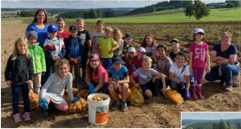
Die 1. Klasse bei der Erdäpfelernte