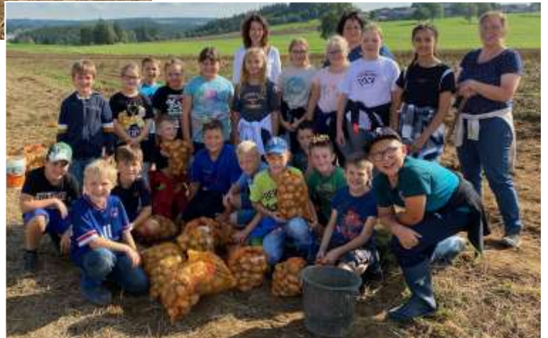
Die 2. Klasse bei der Erdäpfelernte