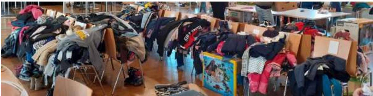
Beim Auseinandersortieren der nicht verkauften Ware! Hier sind viele Hände gefragt!

Ein herzliches Dankeschön an alle Vereinsmitglieder für die geleistete Arbeit. Im Namen des Vorstandteams wünsche ich allen Helfern sowie deren Familien eine besinnliche Adventzeit, ein zauberhaftes Weihnachtsfest sowie ein gesundes neues Jahr 2024.