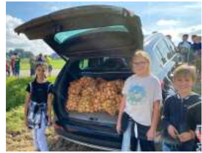
Erdäpfeltransport im Auto der Direktorin