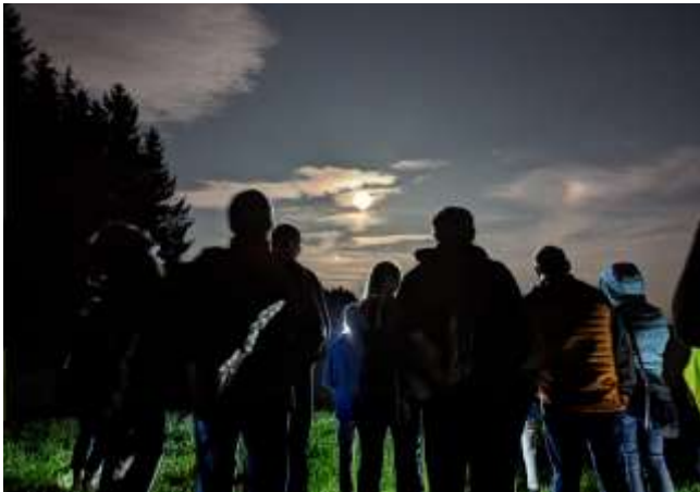
Vollmondwanderungen sind besonders beliebt