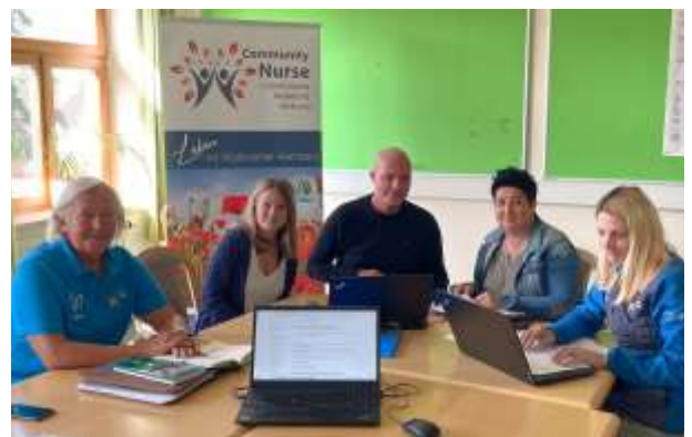
Community Nurse Team