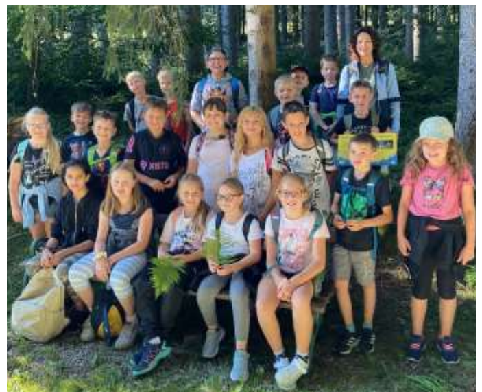
Wandertag 2. Klasse