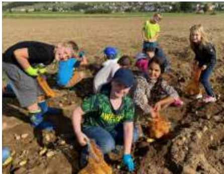
Die Kinder waren mit großer Freude dabei