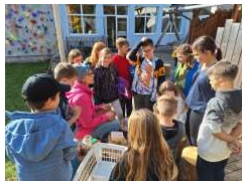
Die Schüler der 1. Klasse beim Bodenworkshop

Die Koordinierungsstelle Wald sieht sich als Informations- und Vermittlungsplattform für alle Themen rund um den „Klimafitten Wald“ in der KLAR! Waldviertler Kernland. Unter dem Motto „Die Koordinierungsstelle Wald informiert“ erscheinen in der Gemeindezeitung ab sofort regelmäßig informative Artikel für alle Waldbesitzer und Waldbesitzerinnen.