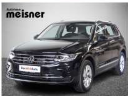
VW Tiguan TDI 4MOTION DSG 150 PS, EZ: 5/23, 15.000 km Navigationssystem, Anhängervorrichtung, LED-Scheinwerfer, u.v.m. Aktionspreis: € 43.490,-