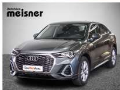
Audi Q3 Sportback TDI quattro S line 150 PS, EZ: 5/22, 20.000 km Navigationssystem, Anhängervorrichtung, LED-Scheinwerfer, u.v.m. Aktionspreis: € 48.490,-