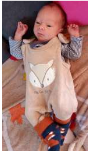
Manuel Weiss Edlesberg 3a 5. September 2023