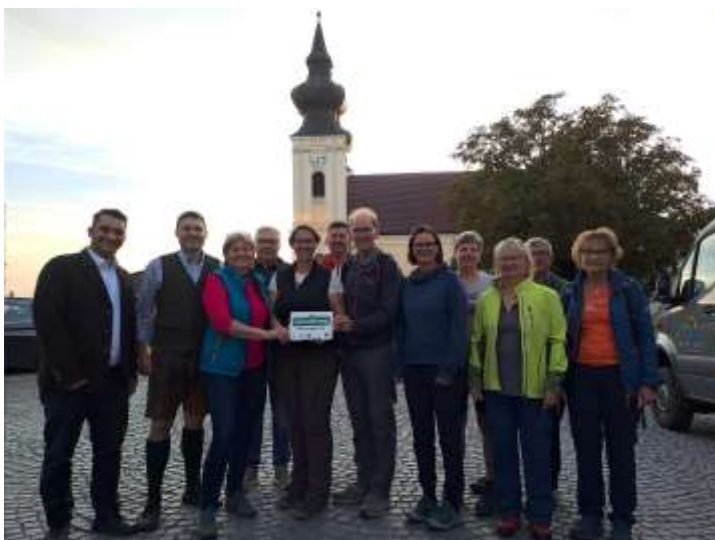
3. LebenswegPartnerStammtisch Partnerbetriebe und Wanderbeauftragte beim LebenswegStammtisch in Maria Taferl

office@lebensweg.info www.lebensweg.info