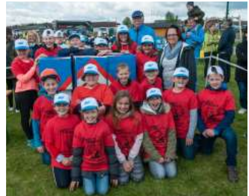
Zweiter Platz der 4. Schulstufe bei der Safety Tour in Waldenstein