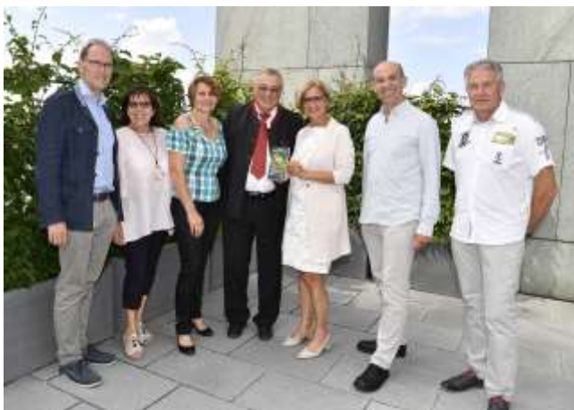
Das Team des Vereins Lebensweg zu Besuch bei Landeshauptfrau Johanna Mikl-Leitner