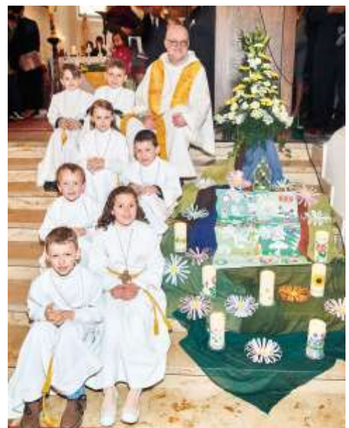
Erstkommunion 12. Mai 2019