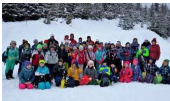
Nordischer Skitag in der Biathlonanlage Gutenbrunn