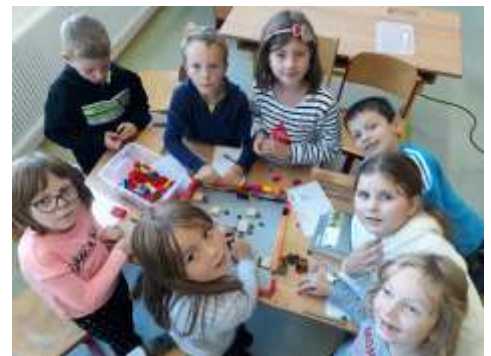
Das Arbeiten mit Lego im neuen Gegenstand „IBFM“ macht den Kindern sichtlich Spaß