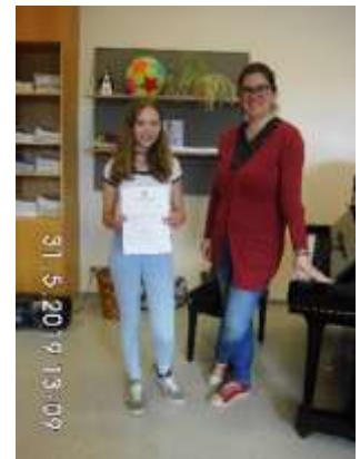
Anna Ledermüller Saxophon - Bronze