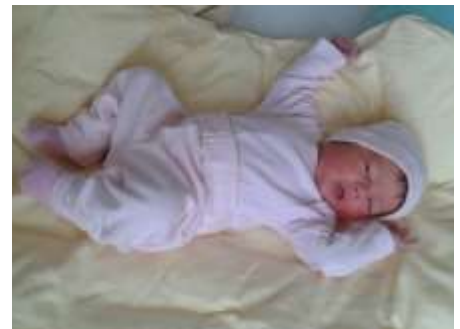
Aylin Duyar Bahnstraße 4/2 geb. am 19. Mai 2019