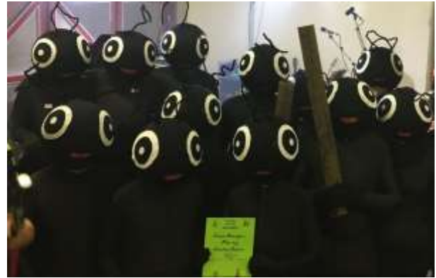
Auch unter den Siegern: Die „Broatoasch-Omassn“